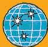
ipari, intézeti egyéb tisztítás, tisztítóanyagok