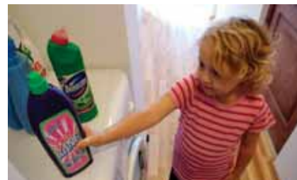
GYERMEKBIZTOS HÁZTARTÁSI TISZTÍTÓSZERES