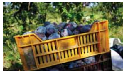
„SZEDD MAGAD!” ŐSZ ELEJI GYÜMÖLCSKÖRKÉP