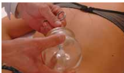
MOXA, SZIKE, HOMEOPÁTIA – ALTERNATÍV GYÓGYMÓDOK